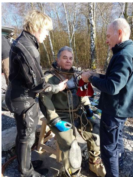
Allo Beaumont ?

On installe les écouteurs sur les oreilles pour la communication. Un bonnet pour fixer ces écouteurs et pour se protéger la tête. C'est la tête qui appuiera sur la purge pour chasser l'air en excédent.