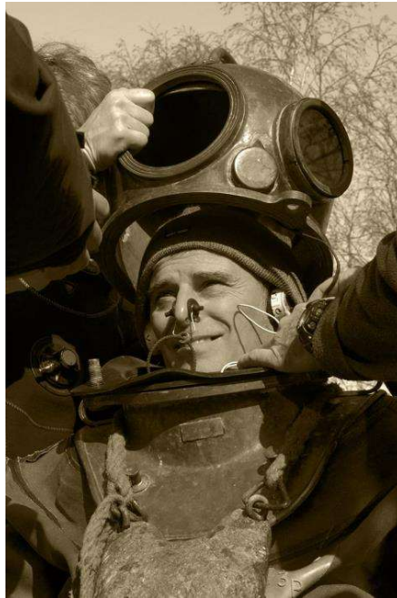
Un cosmonaute ?