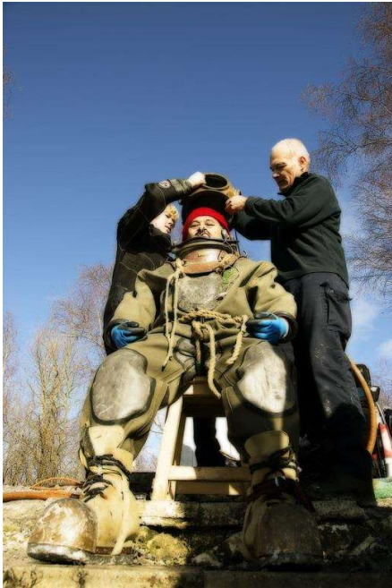
Attention au nez

Le casque à 3 hublots arrive par-dessus. Seul le hublot de face n'est pas fixe. Encore un peu plus de poids sur les épaules. Une clé anglaise serre les 3 gros boulons, pinçant ainsi le joint plat.