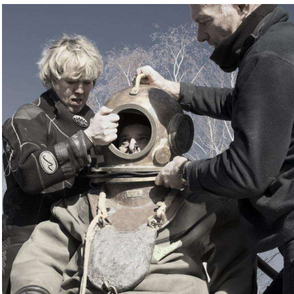
Boite de conserve ?