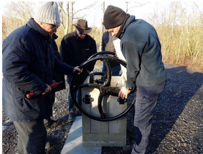
et du deuxième