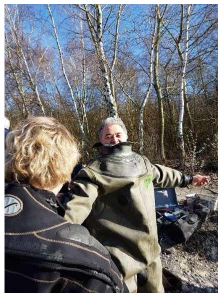
Tête passée, victoire !