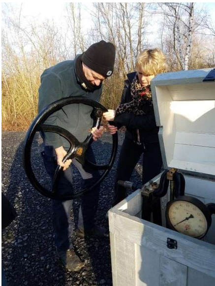
Montage d'un volant

La mise à l'eau se fait sur la petite plage située entre les pontons n°3 et n°4.