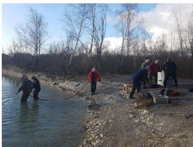
1 personne à l'eau, 6 aides de camp

Et c'est parti pour plonger. Attraper la corde de sécurité, il faut se lever du tabouret et marcher vers l'eau. En tout, 80 kg d'équipement. 2 personnes pour vous guider, chaque pas est difficile, l'eau arrive et commence à soulager ce satané poids. Archimède joue son rôle.