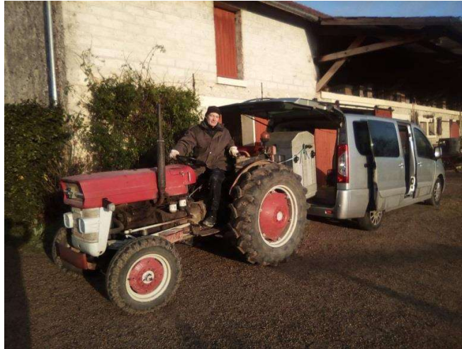
Vive le tracteur

Le chargement de la pompe dans la voiture se fait au tracteur mais le déchargement / chargement sur site, c'est à la main, par 4 gaillards costauds.