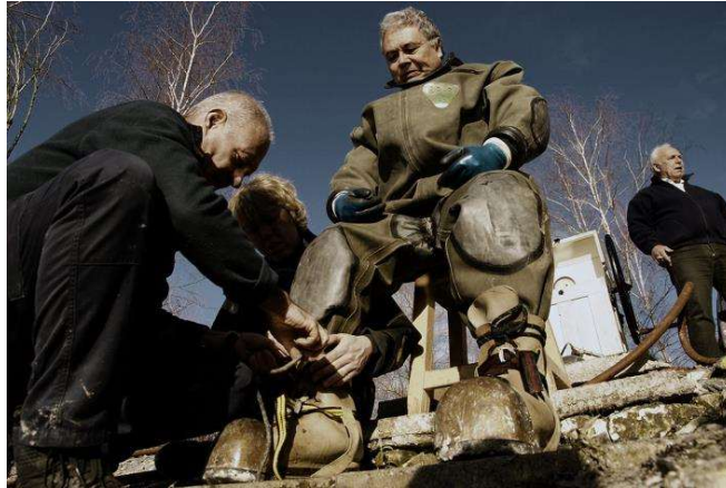
Chaque pied pèse un âne mort.

Enfilage des chaussures de plomb. Pas question de les perdre, donc on se retrouve bien ficelé comme un rôti que l'on va cuire et on rajoute une bonne sangle bien serrée sur chaque tibia.