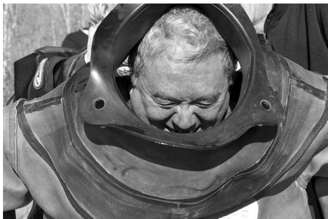
Oh hisse la saucisse

Rien qu'à l'effort, on attrape une bonne suée malgré le temps très frais de 7°C. On se rassoit et on vous annonce que c'était le plus facile !!!