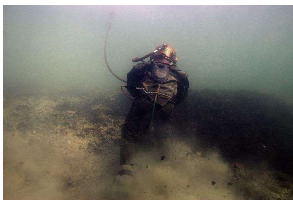
Un peu de vase

La tête sous l'eau la sensation est géniale. Pas froid. On marche à 2 mètres de fond, un pied devant l'autre tout en se penchant. Tout se fait au ralenti.